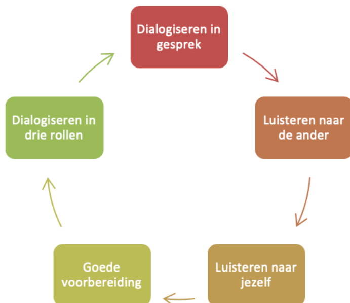
Figuur: dialogische vaardigheidencyclus

De vaardigheidencyclus geeft veel mogelijkheden tot eigen interpretatie en inzetbaarheid. Blokken kunnen naar eigen inzicht worden omgedraaid of overgeslagen. Ieder blok leent zich voor een korte werkvorm of uitbreiding naar volledig lesuur of hele lessenserie. Hieronder worden eerst twee logische startpunten aangereikt, waarna ieder blok kort wordt uitgelegd.