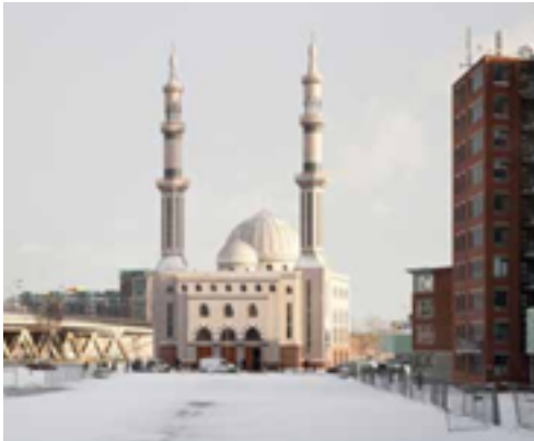
De Essalam moskee in Rotterdam

Klokgelui op zondagochtend geeft aan dat de dienst gaat beginnen. Ook bij bruiloften, begrafenissen en andere rituele handelingen worden de klokken geluid. Nu is dat vanzelfsprekend, maar na de Reformatie mochten katholieken in Nederland twee eeuwen lang niet overal kerken bouwen of hun klokken luiden.