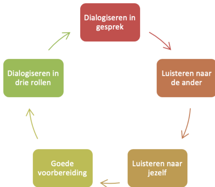
Figuur: dialogische vaardigheidencyclus